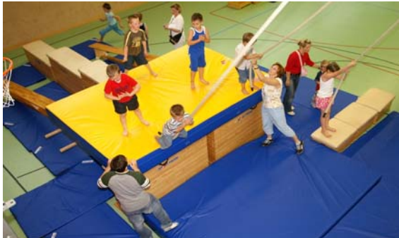
Mülheimer KiTa-Kinder in Bewegung

Im Rahmen des Auftakts unterzeichneten die Verantwortlichen die Vereinbarung zur Zusammenarbeit. Mit ihrer Beteiligung an dem Projekt will die Stadt Mülheim an der Ruhr den ganzheitlichen Ansatz der Gesundheitsvorsorge mit der Qualitäts- und Organisationsentwicklung der KiTas verknüpfen. Das Projekt, das am Ort mit 12 KiTas (mit ca. 700 Kindern) und 75 pädagogischen Fachkräften startet, bietet die Chance, aus den Einrichtungen heraus und gemeinsam mit den Beteiligten ein nachhaltiges Gesamtkonzept zur Gesundheitsförderung der Mülheimer KiTa-Kinder zu entwickeln. Als Termin für die nächste öffentliche regionale Auftaktveranstaltung steht der 28. August in Bielefeld bereits fest.