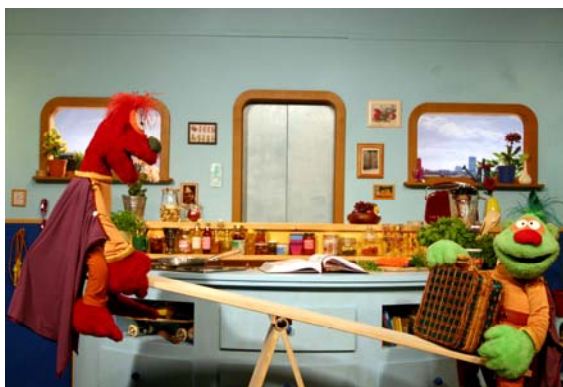
Peb und Pebber im Gleichgewicht

Die Arbeit an der neuen Staffel der TV-Clips „Peb & Pebber – Helden privat“ läuft auf Hochtouren. Inhalte und Botschaften der nächsten 15 Folgen wurden bereits festgelegt, so dass auf dieser Grundlage zur Zeit die Drehbücher erarbeitet werden. Besondere Berücksichtigung finden dabei die Ergebnisse der wissenschaftlichen Evaluation der ersten Staffel. Noch in diesem Jahr sollen die neuen Folgen der „Helden“ bei Super RTL auf Sendung gehen. Geplant ist, dass mit der zweiten Staffel Peb und Pebber auch jenseits der Mattscheibe erlebbar werden, damit die Themen Ernährung und Bewegung in den Familien stärker berücksichtigt werden.