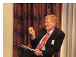
Ortsbürgermeister und MdB Volker Blumentritt