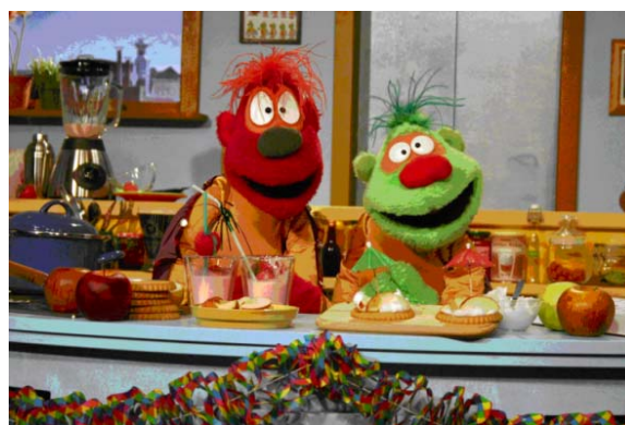
Peb und Pebber in Aktion

Die TV-Clips „Peb und Pebber – Helden privat“ sind seit Juni dieses Jahres beim Kindersender Super RTL mit großem Erfolg auf Sendung. Die durchschnittlichen Marktanteile der TV-Clips sind auch im Vergleich zu den vorlaufenden und nachfolgenden Sendungen positiv. So wurden im Juli 06 z.T. Marktanteile von über 50 Prozent in der Zielgruppe erreicht.